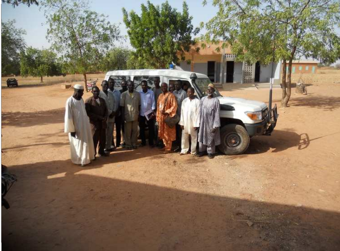
De leden van de verschillende gezondheidscentra die deelnamen aan de bijeenkomst