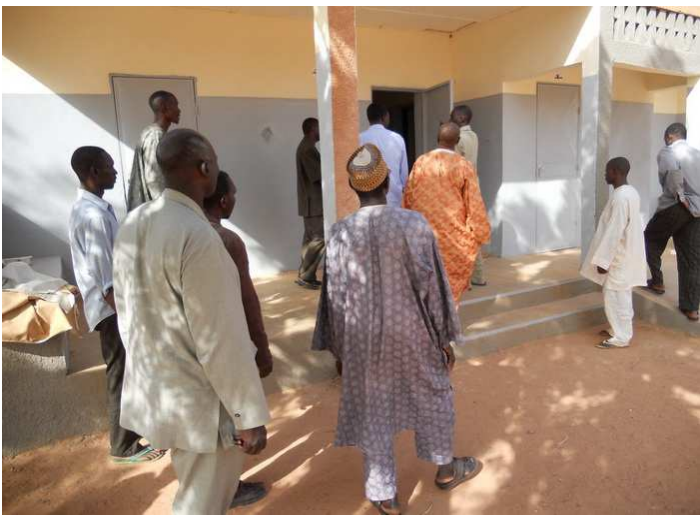
Bezoek aan het 'moederhuis' van het gezondheidscentrum van Kara Kara