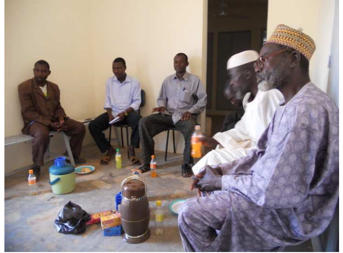
De verantwoordelijken van de gezondheidscentra van Quéchemé en Lido