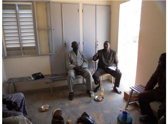
De verantwoordelijken van de gezondheidscentra van Kara Kara en Yeldou (deelgemeente van Kara Kara waar het tweede gezondheidscentrum van de gemeente gevestigd is)